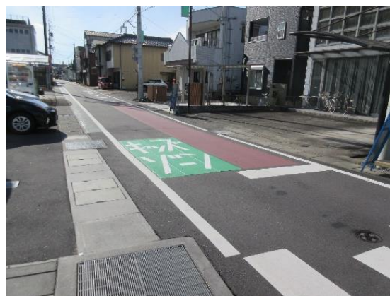
キッズゾーンが設定された道路(広見)