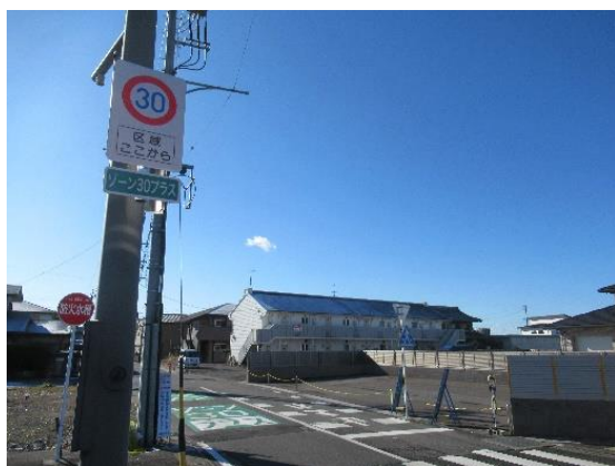
ゾーン 30 プラスが設定された道路(広見)

① 広見地内 「ゾーン 30 プラス」・「キッズゾーン」路面標示、狭さく、ハンブ（段差）、カラー舗装、「ゾーン 30 プラス」看板