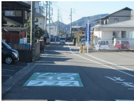
ゾーン 30 プラスが設定された道路(今渡)