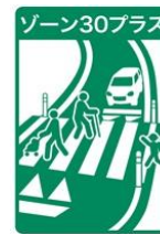
ゾーン 30 プラス看板