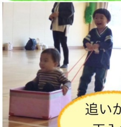
追いかけて 玉入れ