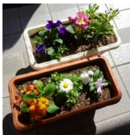
2月27日(火) 共和中学校

兼山小学校・共和中学校の生徒さんからお花とメッセージをいただきました。 ありがとうございました。