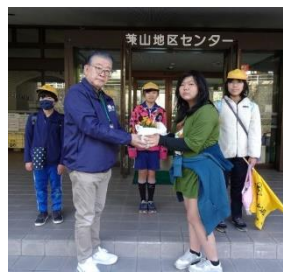
2月28日(水) 兼山小学校