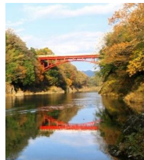
昭和51年 第二次下渡橋

昭和51年12月車社会に対応し、第四次兼山橋に劣らぬ鉄筋コンクリート製の橋「新下渡橋」が架橋されました。