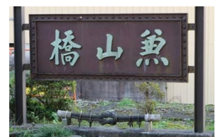
第三次兼山橋 ネームプレート