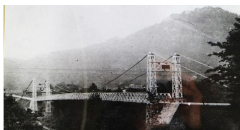
第三次兼山橋 大正12年

大正12年の頃になると、自動車を通れる橋が必要となりました。交通量の増加と橋に続く付帯道路の地形が不便であったため、上流の魚屋町に架けられました。岐阜県初の鉄骨つり橋で、県の直轄事業として行われ、長さ87m、幅4mの鉄骨つり橋が完成しました。通行料は無料となり、自動車、トラ