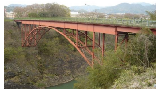
第四次兼山橋 昭和42年

第三次兼山橋は、幾度となく橋板の取り替え修繕をしていましたが、全体の老朽化と交通量に対しての耐荷重が不足してきたため、また新しい橋を造ることになりました。新橋の位置は、第三次兼山橋の上流（魚屋町）、兼山ダムとの間に架橋されました。昭和42年11月に長さ94m、幅6mの鉄筋コンクリート製の橋が完成しました。