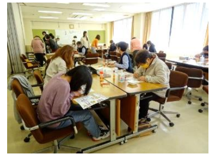
ヴェネチアンアクセサリー作り 3月19日(日)参加者 29名