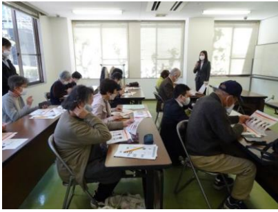
スマホ講座 3月7日(火)参加者 10名/14日(火)参加者 11名