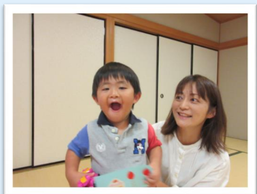
6月18日生まれ あきほくん 2さい