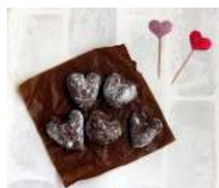
ハートのシュガーバター

【申込み】地区センター窓口または電話 63-4751 やこちらから https://logoform.jp/f/tRyGe