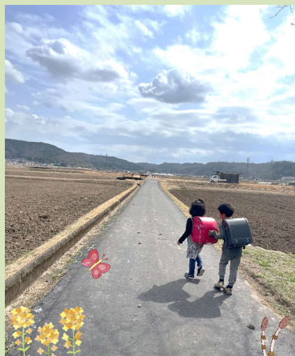
第17回 久々利ふれあい祭りフォトコンテスト応募作品

子どもたちといっしょに通学路を歩きませんか？ 登下校の時間に合わせて東明小までのウォーキング。 季節を感じ、規則正しい毎日のスタートにも役立ちます。 そしてなによりも、子どもたちからもらえる元気が 他では得難いご褒美ですよ!(^^)!