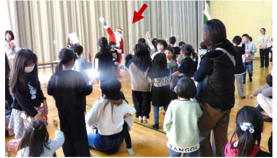
サンタさんと王様じゃんけん