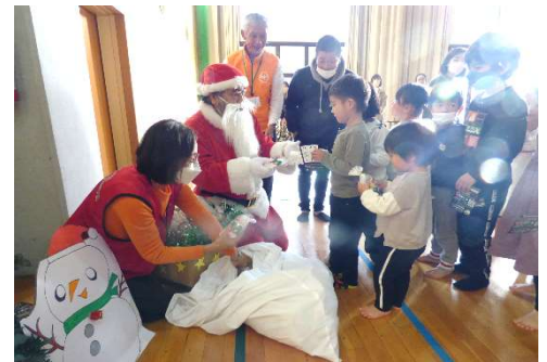
おいしい手作りクッキーのプレゼントだよ。