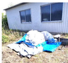
北町防災会のみなさん