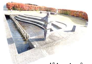
ポケットパーク と門川(かどカワ)