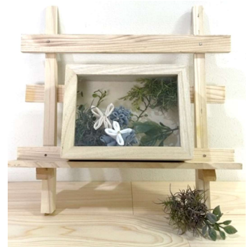
くくり花のアレンジ例

日時：6月28日(水) 10時～12時 場所：久々利地区センター 第1会議室 定員：15人程度(先着順) 参加費：500円 持ち物：針、はさみ、ボンド、手拭き用ふきん 申込方法：久々利地区センター窓口、Tel 64-1120、QRコード