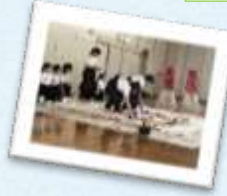
書道パフォーマンス