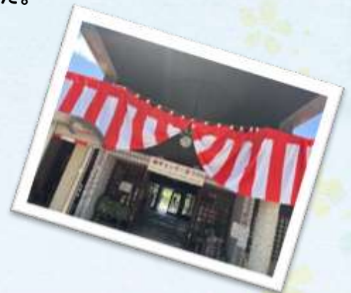
健友連合会 餅つき