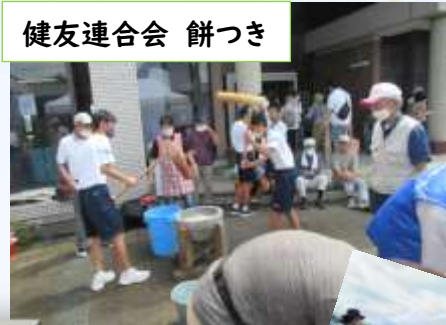
健友連合会 餅つき