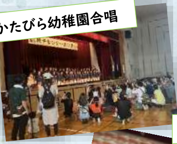
かたびら幼稚園合唱