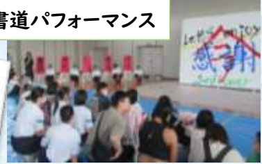
書道パフォーマンス