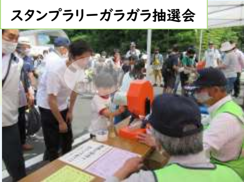
スタンプラリーガラガラ抽選会