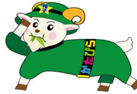
帷子地区センター イメージキャラクター 「くさなックス」