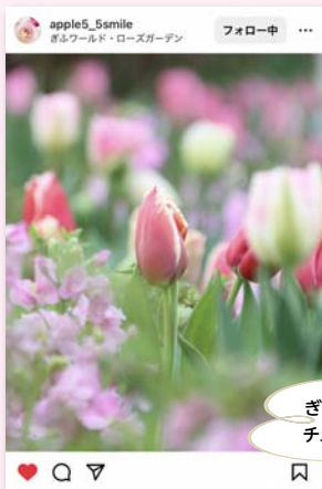
ぎふワールド・ローズガーデンのチューリップ♪春を感じますね