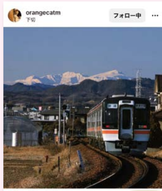
下切の風景 後ろに写る雪山と電車がカッコイイ