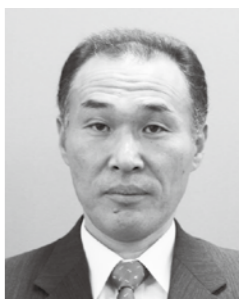
高木伸二副市長 任期：4月1日から4年間 (3期目)