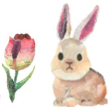
(新聞ちぎり絵の作品例)