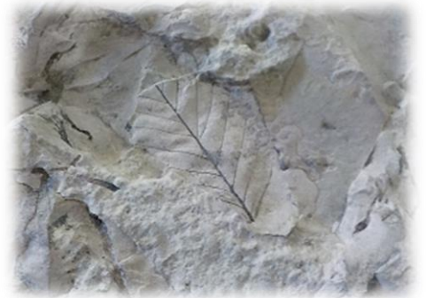
【平牧で見つかった化石】