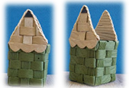
【ペンたて・イメージ写真】