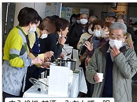
中入りに 甘酒・みかんで一服