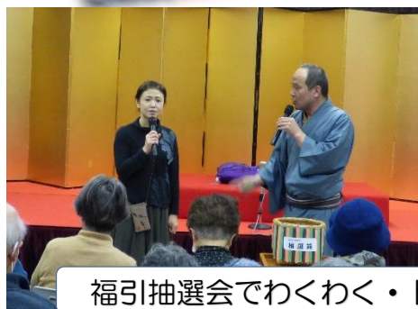
福引抽選会でわくわく・ドキドキ!