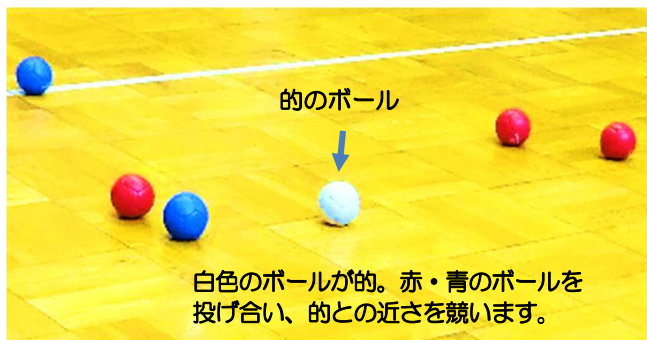
白色のボールが的。赤・青のボールを 投げ合い、的との近さを競います。

昨年のパラリンピック種目の『ボッチャ』。選手の皆さんの活躍が思い出されますね。 目標のボールに向けてボールを投げ、どれだけ近づけられるかを競います。競技方法がカーリングと似ている為、地上のカーリングと呼ばれています。子どもから大人まで、どなたでも楽しめる軽スポーツです。皆さんも、是非体験してみませんか。