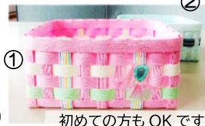
① 初めての方もOKです

ベースカラーは（①ピンク系 ②ブルー系）の2色になります。申込時に色をお知らせください。