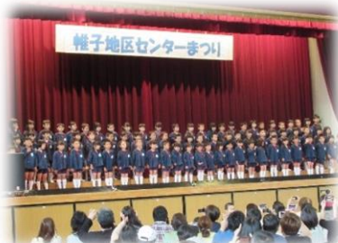
写真は以前のまつりの様子です