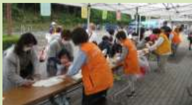
総合受付での健康チェック