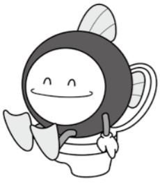
下水道マスコットキャラクター「スイスイ」

食器の洗浄や洗濯時の生活雑排水が側溝などに排出されると、悪臭の発生などにつながります。河川などの環境保全のためにも下水道へ接続してください。下水道が利用できない地域は、し尿と生活雑排水を処理する合併処理浄化槽へ切り替えをお願いします。浄化槽新設の補助金制度など詳細は同課へ問い合わせください。