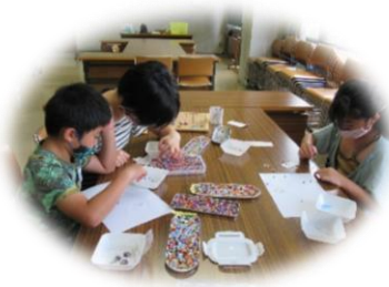
わくわく体験館出前講座 ヴェネチアンアクセサリー作り