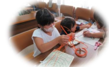
こども手作り教室

4月からも、楽しく学べる講座や、 教室を開催しますので、ぜひ参加 してくださいね♪