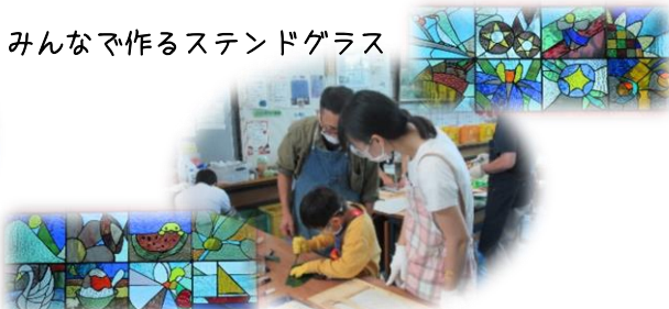
みんなで作るスタンドグラス