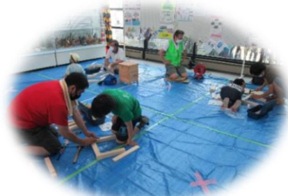
夏休み親子木工教室