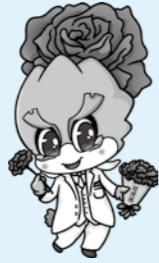
可児市版ギップイー