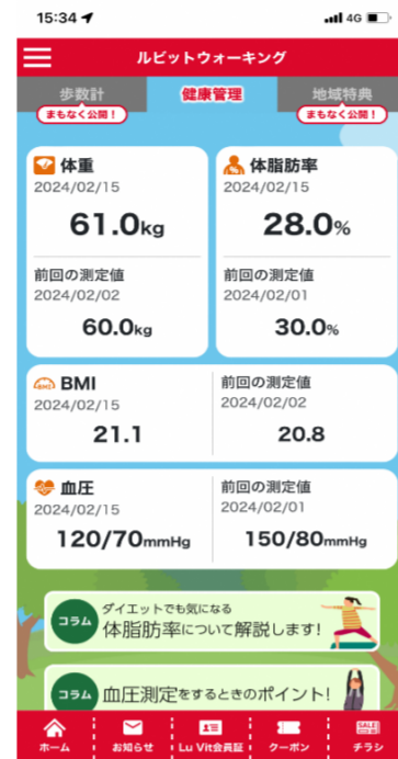
③連携後の表示内容