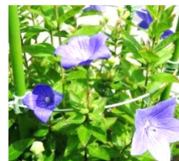
今年も清々しい桔梗の花 が、たくさん咲きました

※コロナ感染拡大の影響で、中止になる場合があります。中止の場合は、申込みの方に連絡させていただきます。