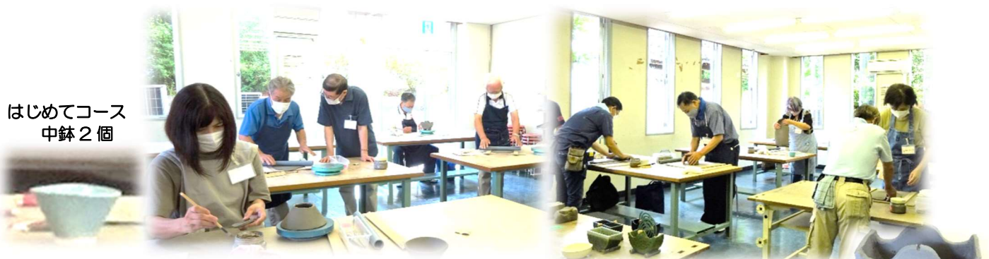
はじめてコース 中鉢2個

今年度は新型コロナウイルス感染症予防の為、募集人数を減らして7月15日（木）に開講しました。はじめてコースは中鉢2個、楽しくコースは蚊遣りの成形を15日と20日に済ませました。素焼きの後、好みの釉薬をかけて本焼きをして完成です。どんな作品になるか楽しみです。