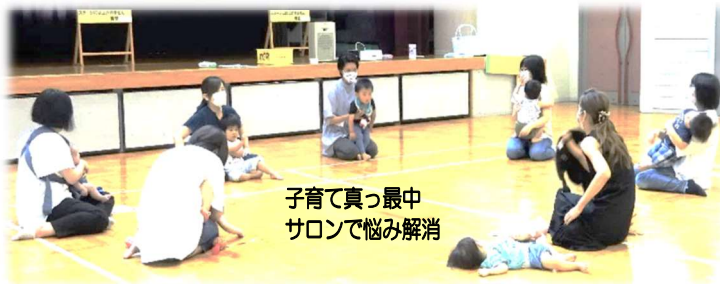
子育て真っ最中 サロンで悩み解消