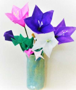
和紙で作った桔梗を 陶器の花筒に飾ります