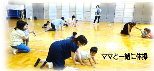
ママと一緒に体操

新型コロナウイルス感染症予防対策のため、2カ月遅れて7月13日（火）にスタートしました。