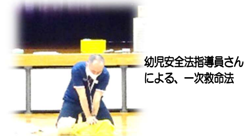
幼児安全法指導員さんによる、一次救命法

講話後のサロンでは、子育てについての悩みなど情報交換をしながら、楽しいひとときを過ごされていました。