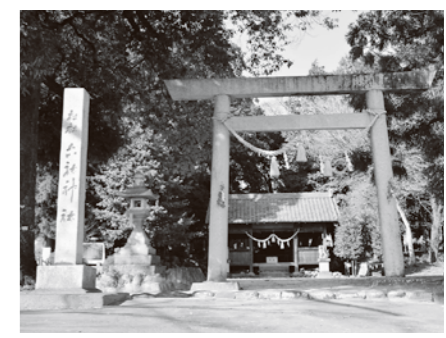
荏戸郷の中心的な神社の1つ 六社神社

「えど」という地名は、市内でも屈指の歴史を誇るものの1つで、古くは嘉禎4年(1238年)の春日神社文書(御嵩町)に「荏戸春近」という地名が記載されています。以降、江戸時代の少し前くらいまでは、現在の御嵩町上恵土、可児市中恵土・下恵土地区一帯は「荏戸郷」と呼ばれていました。「えど」は全国に散見される地名で、河辺や入江などの付近につけられることが多いようです。荏戸郷も北側に木曾川が貫流していることからその地名となった可能性があります。 中恵土は旧伏見町内、古くは「荏戸上郷」だったところに新たにつけられた地名です。昭和30年2月の可児町誕生時、当時の伏見町内では御嵩町への合併を望む地区と、可児町への合併を望む地区とで意見が分かれました。伏見町はいったん御嵩町に合併しましたが、同年4月、分町編入というかたちで前波地区、新田地区、上野地区が可児町へと編入しました。ここで新たな地名として「中恵土」が生まれました。上恵土と下恵土の間なので「中恵土」という、昔とその当時の歴史を踏まえた分かりやすい地名といえるでしょう。