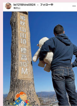
お子さんの百日祝いに 鳩吹山で最高峰の登山デビュー日和