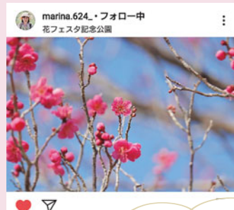
花フェスタに咲く梅の花 青空にピンク色の花が映えてステキ