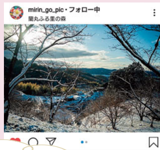
蘭丸ふるさとの森での1枚 雪景色がキレイ