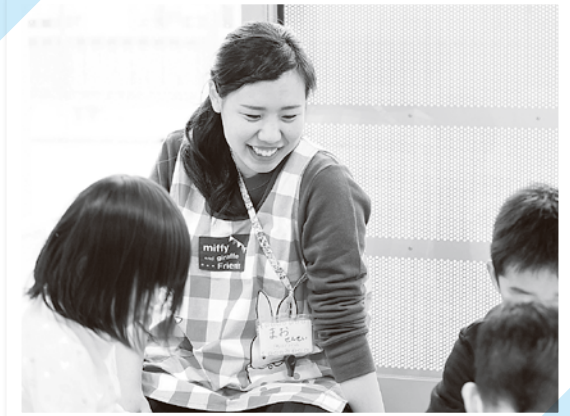
笑顔で働く保育士