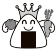
可児市の食育マーク「モリモリキング」

※入賞者には図書カードを進呈。応募作品は未発表の作品に限り、著作権など一切の権利は市に帰属します。応募作品は返却しません。