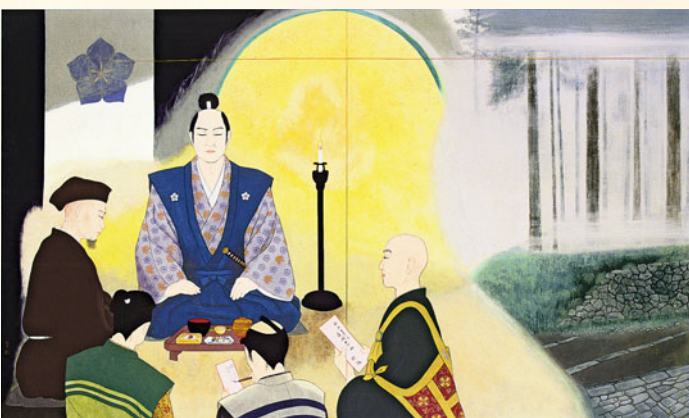
決意(光秀・愛宕山連歌の会) 内田青虹氏寄贈

これが私の『決意』です。この一首を辞世としてくださりませ。人も花もしかるべき「時」に散るからこそ美しいものです。汝もそうは思ひませぬか？