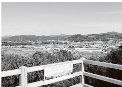
展望台からの眺め

明智城跡の周辺には駐車場がありません。花フェスタ記念公園駐車場(無料)を利用してください。