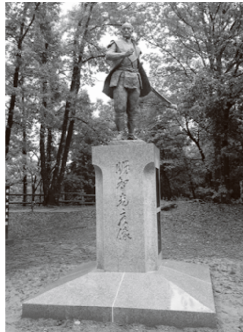
明智城本丸跡に建立された明智光秀公ブロンズ像

明智城跡の周辺には駐車場がありません。花フェスタ記念公園駐車場(無料)を利用してください。