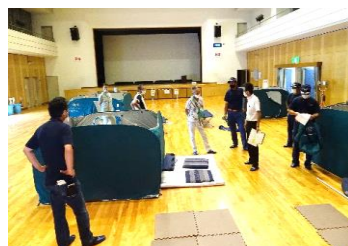
簡易ベッドとワンタッチパーティションの設置訓練