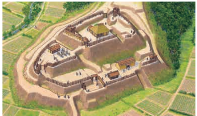
今城復元イラスト