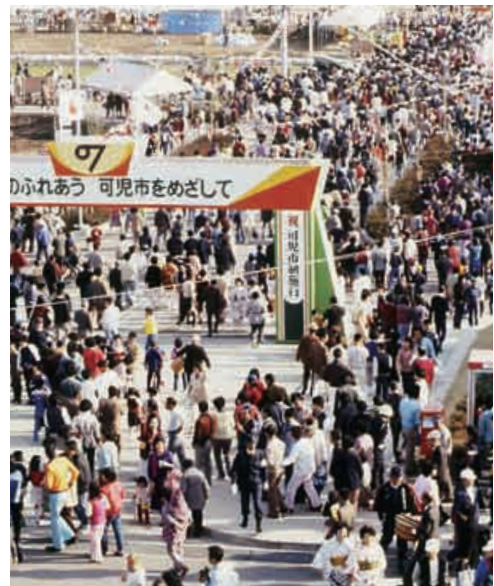
市制記念イベントの様子

平成17年(2005)には、平成の大合併により、可児市は可児郡兼山町と合併しました。この合併により、可児市の面積は87.57km 2 となり、人口は10万人をこえました。