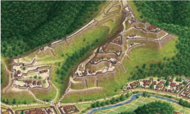
久々利城復元イラスト (株式会社パロマ提供)

土岐氏一族のお城としては、久々利城、明智城、羽崎城がありました。特に久々利城は大きなお城でした。このお城の出入口はとても複雑で、一度に多くの人々が攻められないように、入りこんだ人を迷わせるようにつくられています。その他にも人が簡単に登れないような急な斜面が特徴です。