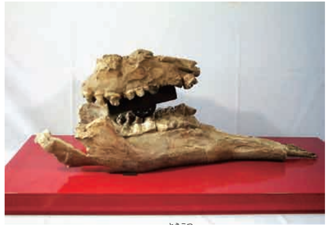
アネクテンスゾウの頭骨の化石（複製）