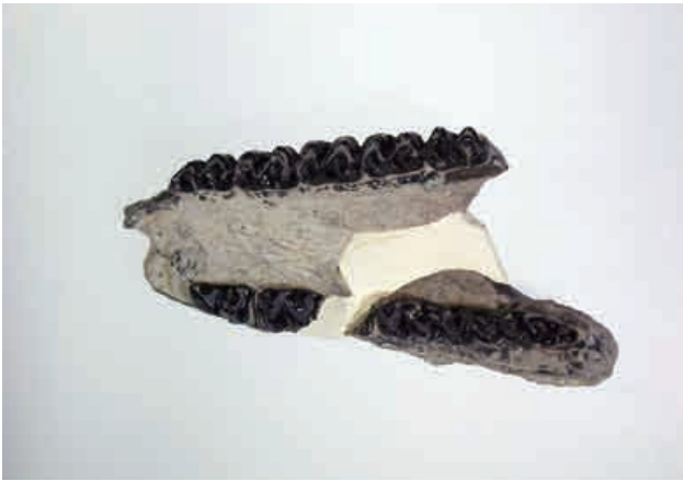
ヒラマキウマのアゴの化石（複製）