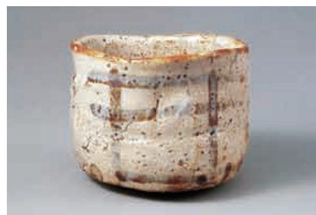
国宝の志野茶わん「卯花牆」 (三井記念美術館所蔵)