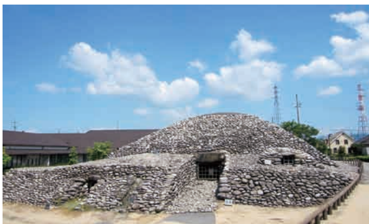
川合次郎兵衛塚1号墳（川合地区）