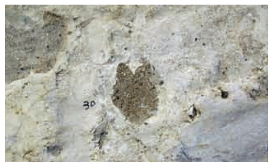
動物の足あとと思われる化石 (下切地区)

平成21年6月、下切地区の河川改修工事のさい、動物の足あとと思われる化石が大量に見つかりました。足あとの化石は、約300㎡の範囲に大小650個ほどが確認されました。この足あとは、いろいろな動物が水辺に集まっていたことを示すものです。