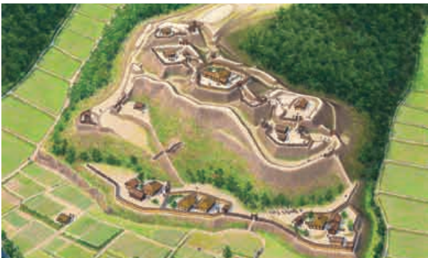
大森城復元イラスト

大森城や今城、室原城などはもともと、村を守るための小さなお城でした。その後、大きな戦いのためにつくりかえられました。塩河城、吹ヶ洞岩は戦いのために新しくつくったお城なのかもしれません。