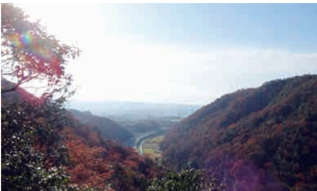
土田城跡からのながめ