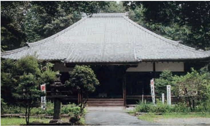
薬王寺本堂（帷子地区）