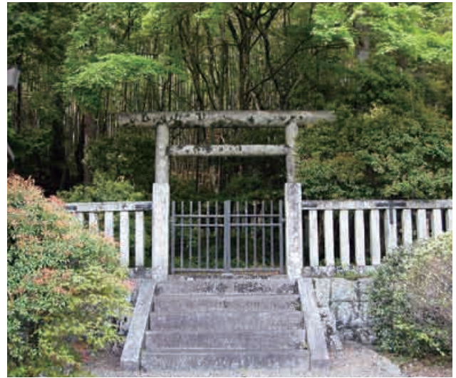
八坂入彦命の墓 (久々利地区)