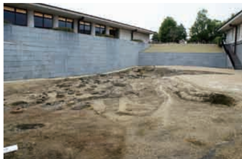
木簡が見つかった飛鳥池遺跡 （奈良県明日香村）

では、「カニ」という地名はどうしてついたのでしょうか？ いくつかの説を紹介します。