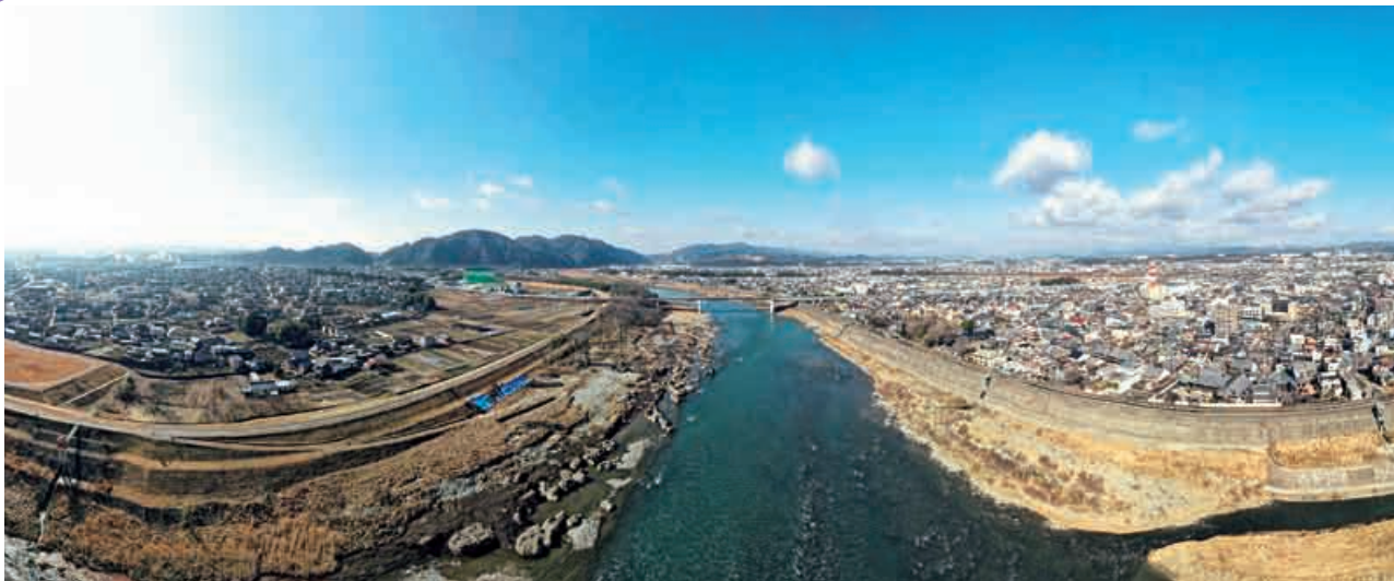
大井戸渡の古戦場跡（広角撮影：左が可児市）