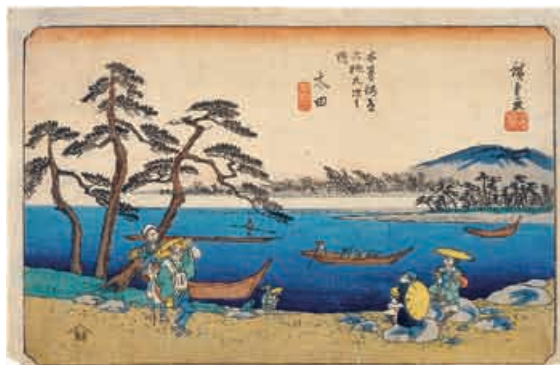
江戸時代の太田の渡し(手前側が可児と思われる) (中山道広重美術館所蔵)

土田の日本ライン下り渡船場付近は、現在は公園となっており、散策しながら季節の草花や木曾川の風景を楽しむことができます。