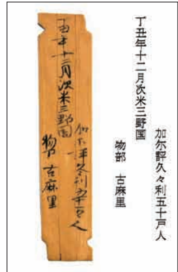
奈良県飛鳥池遺跡出土の木簡 （複製）