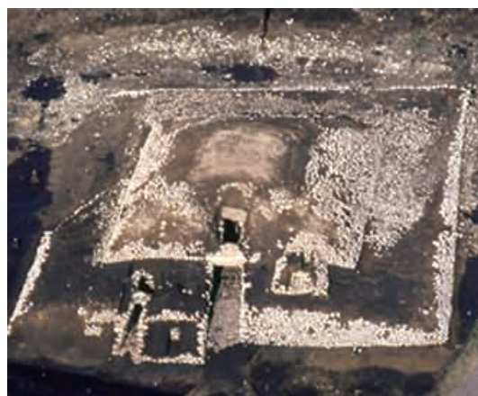
空中写真（発掘調査時）