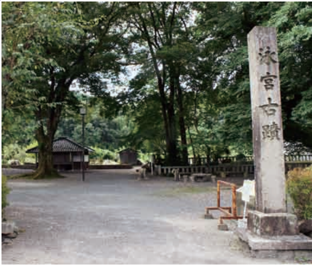
泳宮公園 (久々利地区)