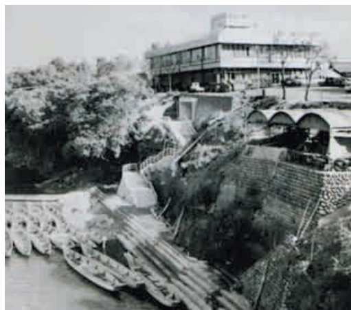
日本ライン下りの乗船場(昭和45年)