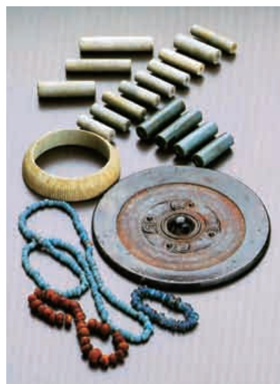
長塚古墳から出土した 銅鏡や管玉等

古墳の大きさや見つかった品物から考えて、長塚古墳は、可児をふくむ東美濃一帯を支配していたリーダーのお墓と考えられます。