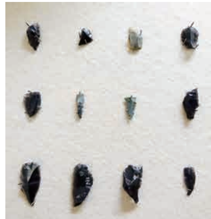
川合地区で見つかった石器

見つかった石器は、石材を割ったり欠いたりしながら、ナイフのように加工したものです。