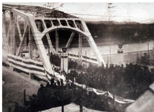
太田橋開通式(昭和2年) (今渡 田口宏家資料)