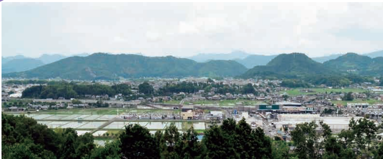
明智荘（広角撮影：明智城跡より）