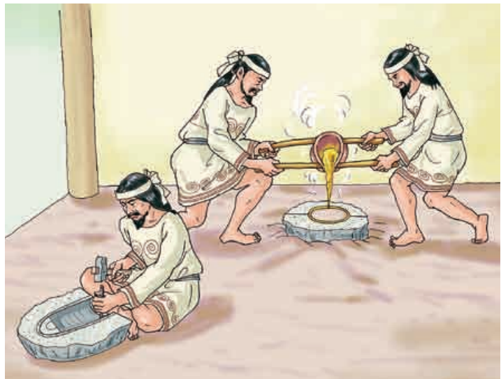
銅鐸づくりの想像図