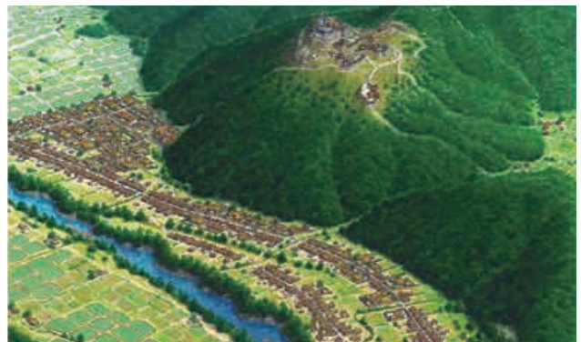
美濃金山城下町復元イラスト