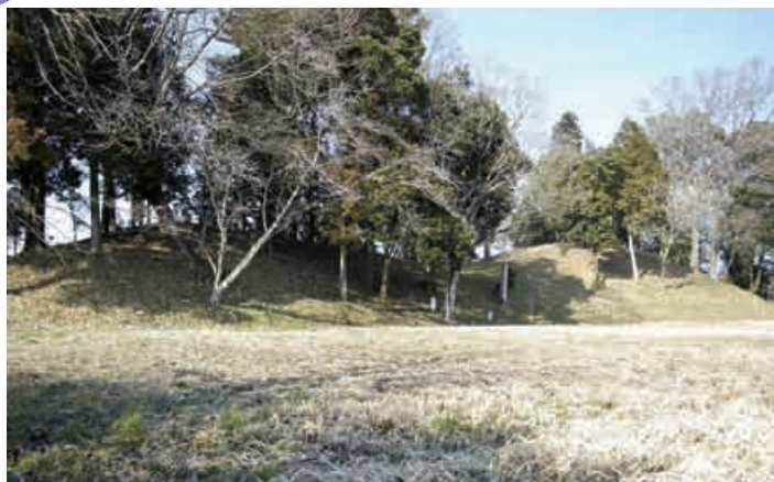
長塚古墳（中恵土地区）