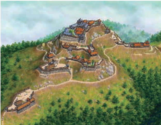
美濃金山城復元イラスト