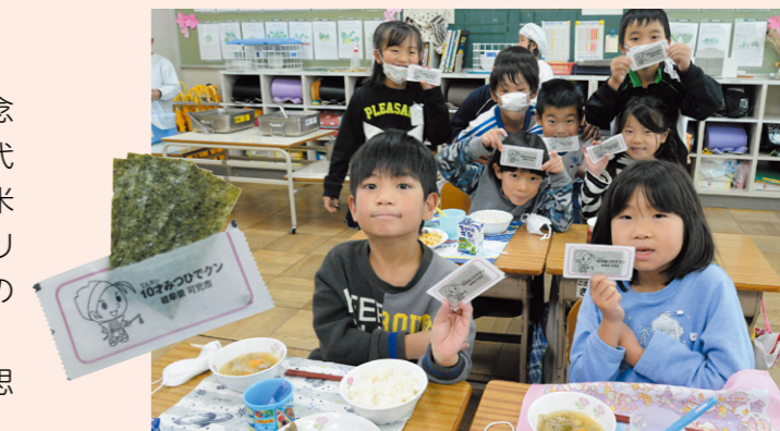
かわいいパッケージで食欲もアップ

いつもとは一味違った給食に「戦国時代のことを思いながらいただきました」といった事も聞けました。