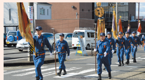
市中行進で雄姿を披露

式典後、市役所で行われた一斉放水では、色鮮やかな水柱に観客から歓声が上がりました。