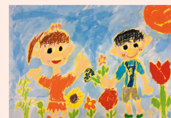
ネメンヨ ロビさんの作品