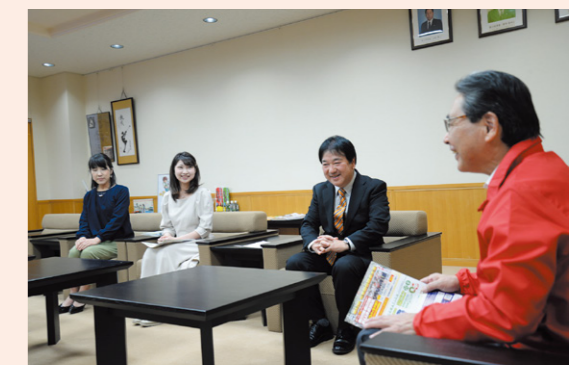
ケーブルテレビ可児の職員と市長