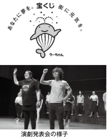
演劇発表会の様子

(公財)可児市文化芸術振興財団が、宝くじの助成金で日英国際交流事業を実施しました。