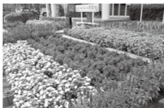
若葉台自治会花壇