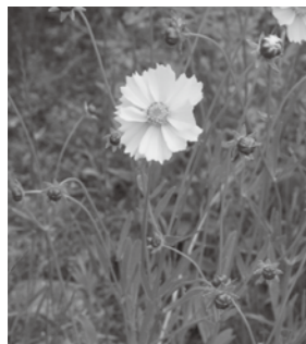
オオキンケイギク

市内には、まだ多くのオオキンケイギクが生息しています。引き続き防除のご協力をお願いします。