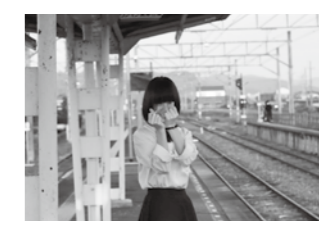
昨年のグランプリ作品「素朴な笑顔」