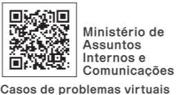
Casos de problemas virtuais