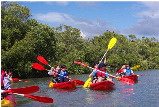
2人一組で協力してカヌーを漕いでいる

バスで上流地点まで行き、そこからカヤックに乗って4キロのなだらかな川を、2時間ほどかけてゆっくり下った。川からは野生のコアラを3匹見つけることができた。また、日本では見ることのできないカラフルな野生のインコや、オオコウモリの生息地で大量の群れを見ることができた。顧問の指導、解説のもと、安全に野生動物の生態や特徴を学ぶことができた。