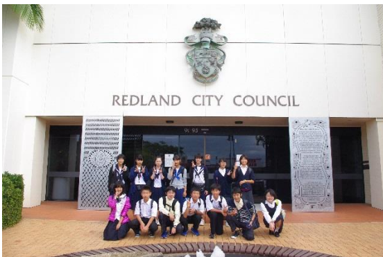
レッドランド市役所の前で集合写真

クリーブランド高校から徒歩でレッドランド市役所に向かった。カレン・ウィリアムズ市長の歓迎挨拶後、生徒たちが英語で可児市の紹介を行った。数名の議員も出席し、生徒たちはモーニングティーと共に会話を楽しんだ。