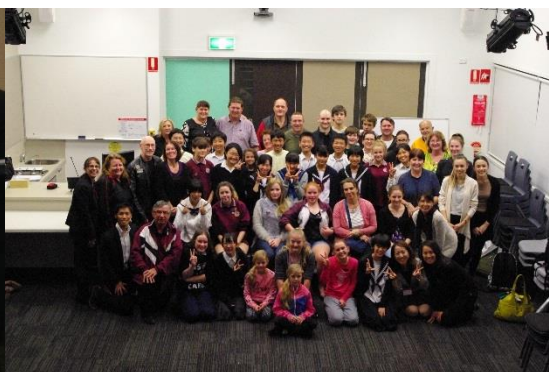
ホストファミリーも加わり、記念撮影