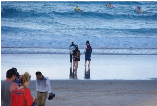
目の前に広がる果てしない海に圧倒

ゴールドコーストにあるサーファーズパラダイスは、オーストラリアでの人気観光スポットであり、日本人にも人気の場所である。高層ビル、ホテルが立ち並び繁華街はレストランやショップで溢れている。海沿いにある街で、冬にもかかわらずサーフィンをする人も多くいた。買物や海での遊びを楽しんだ。