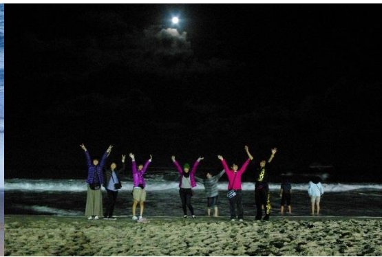
夜の海で遊び、喜ぶ生徒たち