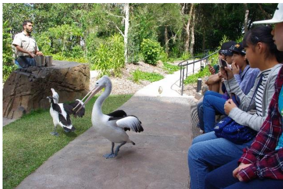
鳥のショーを見学している