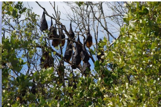
オオコウモリ 英名 Frying Fox（飛ぶキツネ）