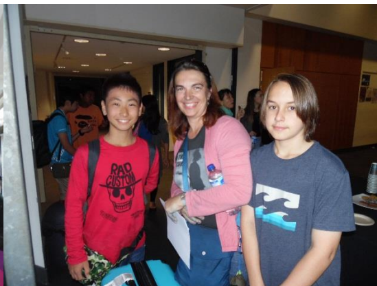
ホストマザーとホストブラザー