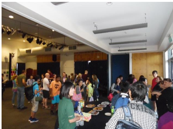
クリーブランド高校ホールにてファミリーと面会

簡易な軽食（スイーツ）とドリンクでもてなしを受けた。ホストファミリーが続々と会場に入ってきて、その都度生徒とホストファミリーのマッチングを行った。ほとんどの生徒がメールで予め連絡を取り合っていたため、緊張の反面、やっと会えたという喜びの気持ちもあったようだ。教頭の挨拶後、30分程度歓談し、各家庭に帰って行った。