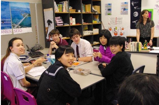
お菓子を食べながら、カジュアルな雰囲気

学校体験2日目は、4コマの授業に参加した。日本語の授業では、日本語や英語でそれぞれ自己紹介や質問などを投げかけ合った。また相手の生徒の日本語の発表を聞いたり、歌を披露し合ったりして交流をした。他の時間は、それぞれのバディの授業に参加した。可児から持って行ったペンパルの手紙をそれぞれ相手の生徒に渡すことができた。