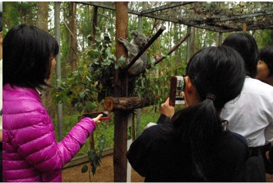
入院中のコアラを間近で観察している