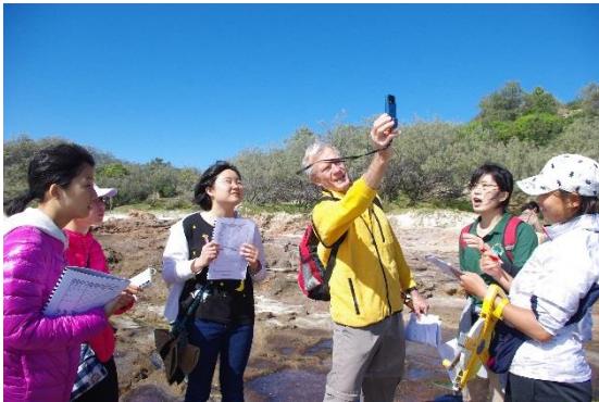
講師に風力の計測の方法を教えてもらっている

バスのままフェリーに乗って1時間弱かけて島に到着した。前半はクイーンズランド大学の講師の指導のもと海洋生物研究体験を行った。岩場で、海に最も近い部分、そこから10メートル離れた場所、また更に10メートル離れた場所の海洋生物を観察した。同時に気温、風力、水温、観察範囲の水の割合等、詳しく記録し、場所によって異なる生物が生息する事を学んだ。後半は、散策道を歩きながら、双眼鏡を使い海の生物を探した。クジラ、イルカ、海ガメを見つけることができた。更に散策をし、1頭のカンガルーや野生のコアラを何匹か見つけた。そのうちの1匹は赤ちゃんを抱えており、この光景は講師もめったに見ることのない大変貴重なものであるとのことだ。最後にペリカンが多数いるという港へ行き、巨大なペリカンを何羽も見ることができた。