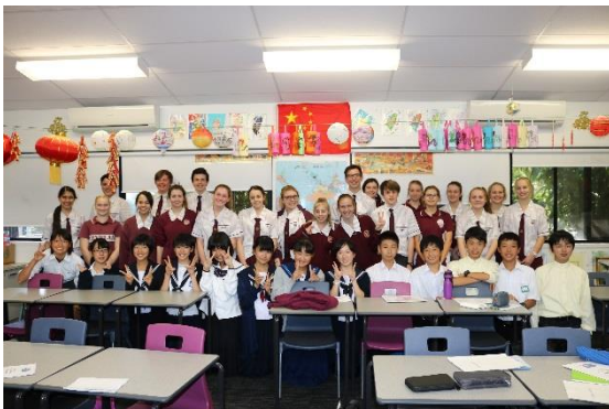
日本語クラス（2クラス合同）のメンバー