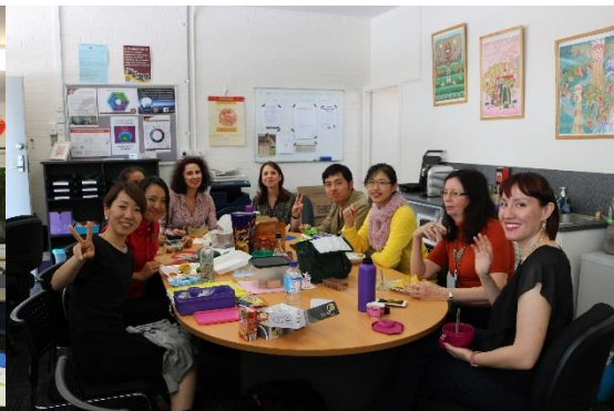
言語（日・中・仏）の先生たちと引率が交流