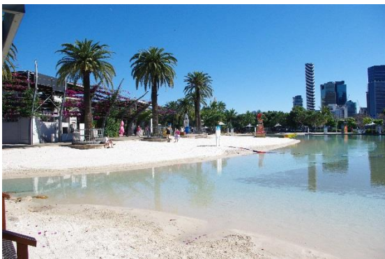
ブリスベンの街中に作られた人工ビーチ