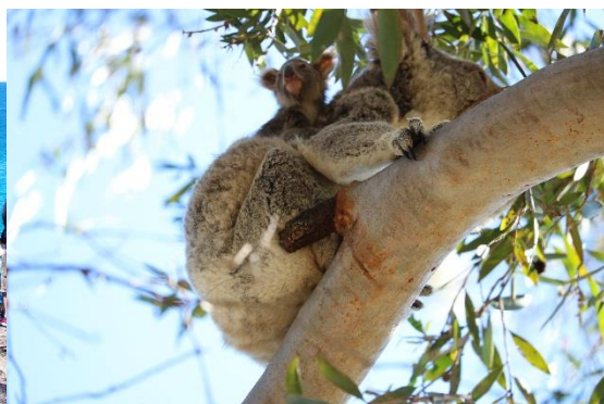
希少！赤ちゃんを抱くコアラを発見