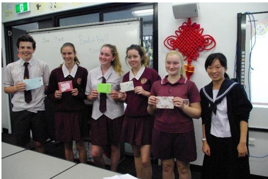
手紙を受け取る生徒たち ※右の生徒は交換相手同士