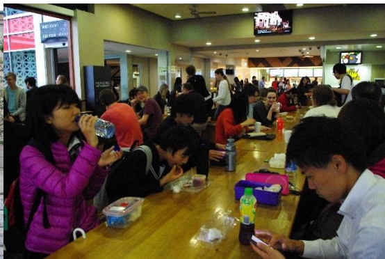
カフェテリアでのランチで大学生生活を体験