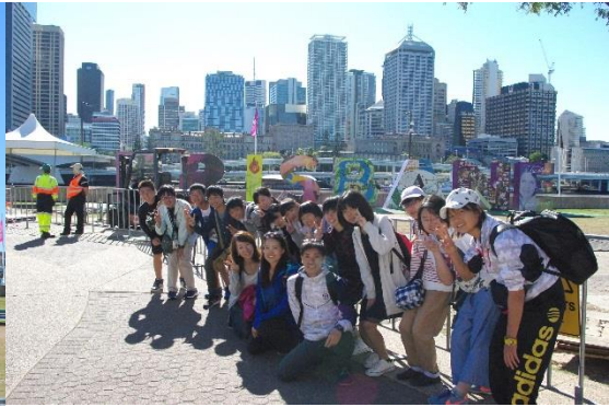
サウスバンクで高層ビルを背景に集合写真