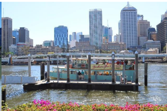
ブリスベン川の水上ポート停留所