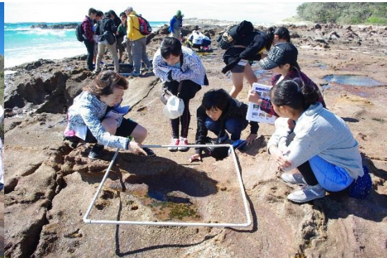
白い枠内での水の割合、生息する生物を観察する