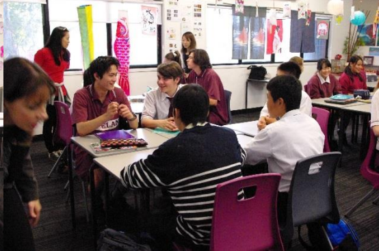
日本をテーマにしたクラスルーム