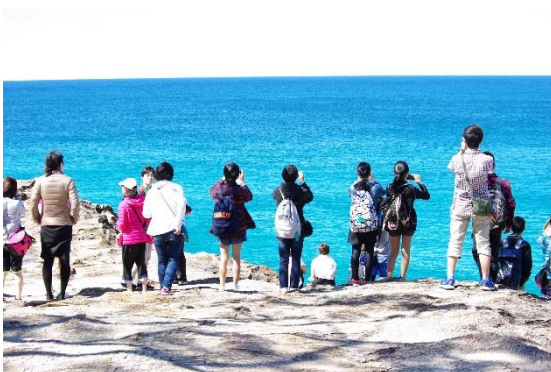
双眼鏡を使って海の生物を探索している