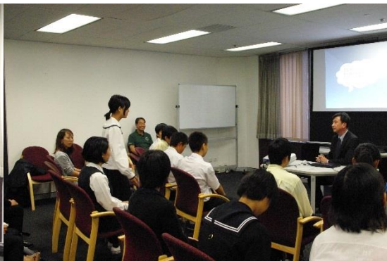
渡部隆彦主席領事に質問をする生徒