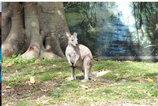
ワラビーやカンガルーが間近で見られる