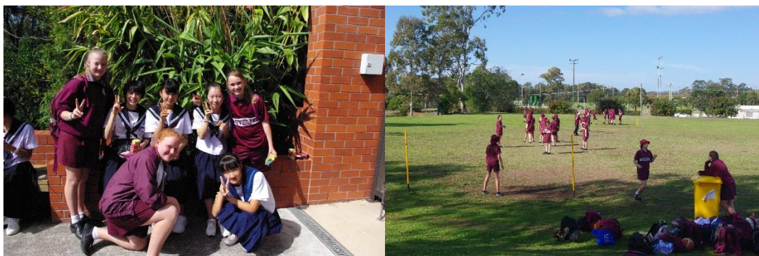
ランチをしながら団欒する生徒たち

各生徒は、バディというクリーブランド高校の同年代の生徒が割り当てられた。バディはホストファミリーにもなっているのので、学校への登下校は一緒に行く。学校体験1日目は、校内を見学した後、バディの実際受けている授業（数学、理科、日本語、体育等）にそれぞれ付いて行き、授業の見学をした。