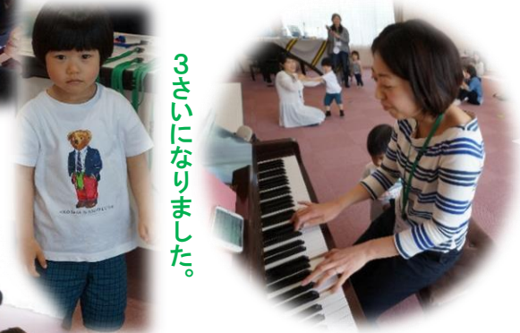
3さいになりました。