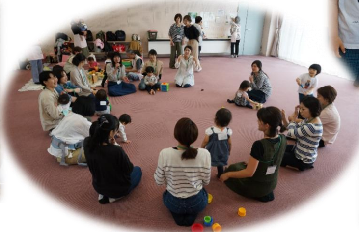
1人ずつ自己紹介・マイフォームを紹介しました