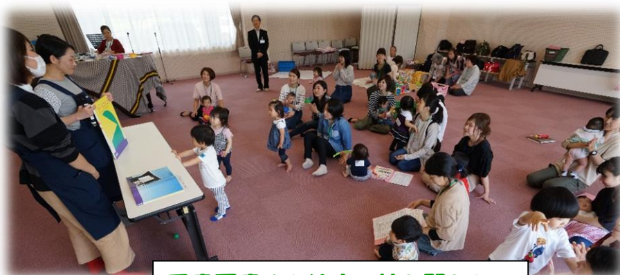
図書司書さん絵本の読み聞かせ