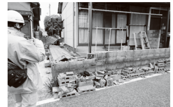
道路側などにブロック塀が倒壊した様子(平成 28 年 熊本地震被災地撮影)

対象経費とは「撤去するブロック塀等の長さ 1 m 当たり 1 万円を乗じて得た額」、「撤去に要する費用(見積額)」のいずれか低い方です。