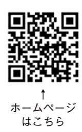
↑ホームページはこちら

平成30年度より一般不妊治療費と男性不妊治療費の一部助成を始めました。 男性不妊治療費については特定不妊治療費助成に上乗せになります。詳しくはホームページをご覧ください。