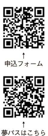
↑申込フォーム ↑夢パスはこちら

水戸ホーリーホック戦に市民500人を先着で無料招待します。希望者は申込フォームからお申し込みください。 日時 6月2日(土) 午後3時～ 場所 岐阜メモリアルセンター長良川競技場(岐阜市) ※小学生は夢パスでFC岐阜のホーム戦が全試合無料になります。