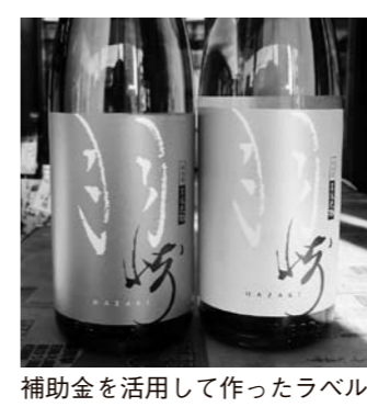
補助金を活用して作ったラベル

申込方法 経済政策課に備え付けの申請書に必要書類を添付し提出する ※様式は市ホームページからダウンロードもできます。 申込締切 5月31日(木)