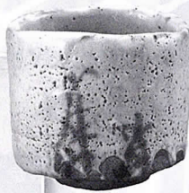
「志野菊絵茶碗 銘 随縁」 (昭和36年)