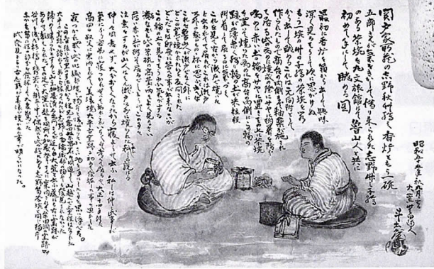
「古窯発見端緒図」 (昭和55年)