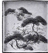
「吉野山絵四方皿 尾形乾山作」 (江戸時代)