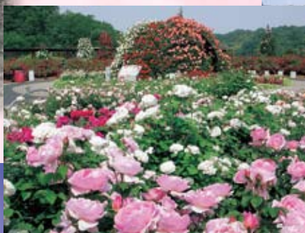
花フェスタ 記念公園