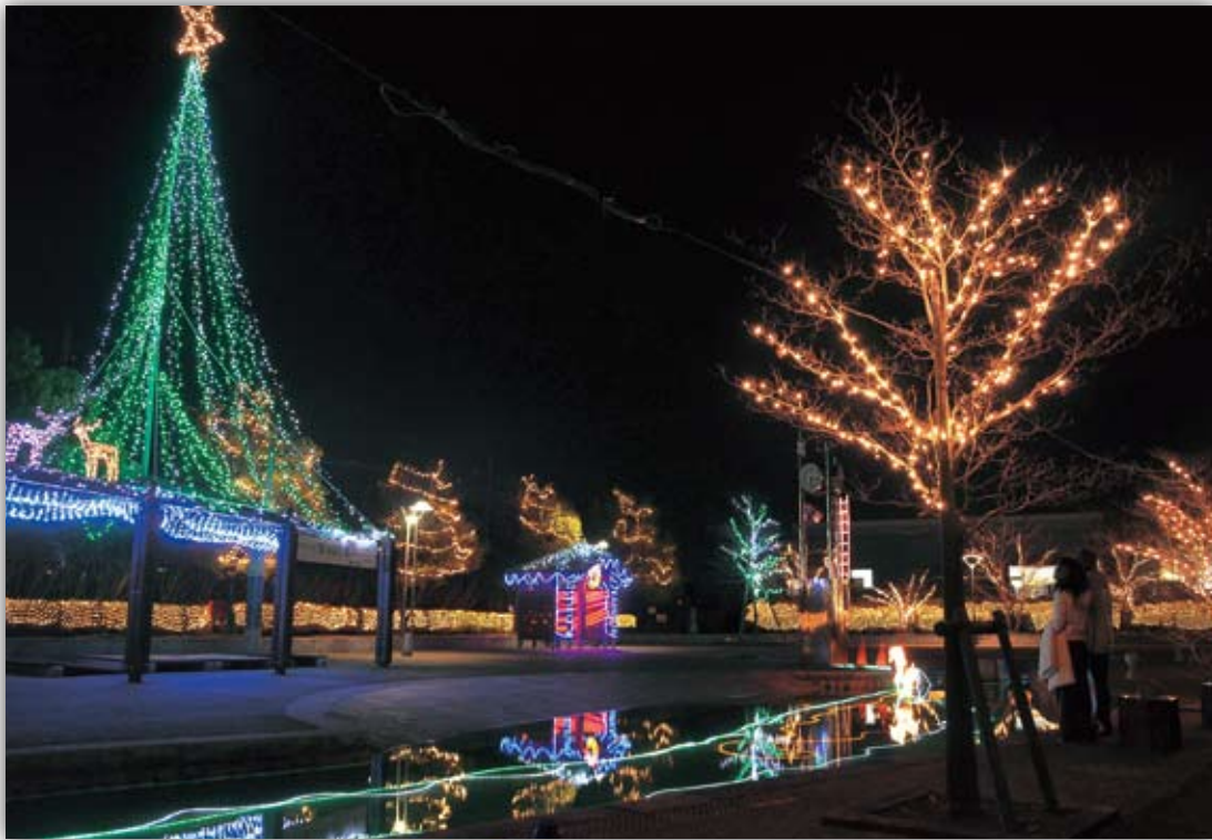
可児商工会議所が、イルミネーションを開催。 ふるさと川公園に浮かぶ、キラキラと輝く 幻想的な光に、心が和みます。