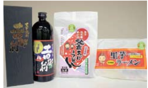
サトイモを使用した商品

さといも塾ではサトイモ栽培を中心とした農業体験の受講生（塾生）を募集するとともに、サトイモのオーナー制度（耕地の貸与によるサトイモの栽培・収穫・販売）を行っています。さといも塾については、NPO法人さといも塾（☎⑤2 2 3 5 URL http://www.17.ocn.ne.jp/~soumubu/ ）までお問い合わせください。