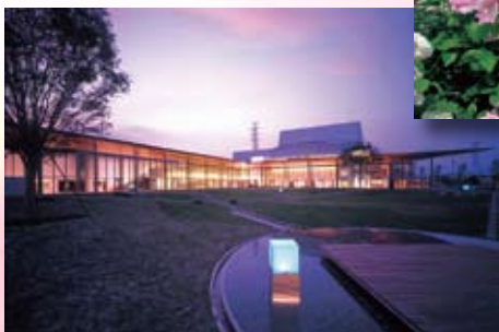
文化創造センター・アーラ