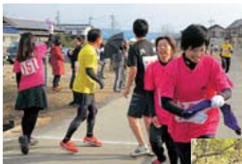
▲タスキを最終走者に託す (広見グラウンド中継所)