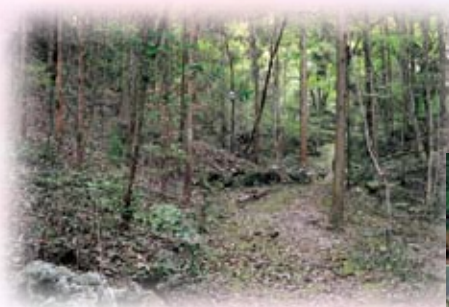
大萱の牟田洞窟跡

今年も、本市が重点的に取り組んでおります、高齢者、子育て、地域経済、防犯防災の各分野をはじめといたしまして、皆さまと一緒に「市民中心のまちづくり」を一層進めてまいりたいと存じます。ご支援、ご協力をよろしくお願いいたします。