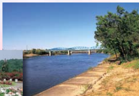
木曾川渡し場遊歩道