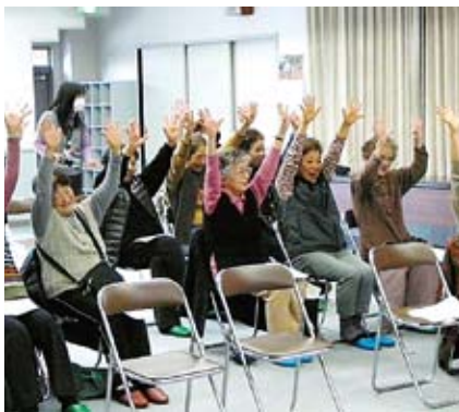
いきいき若葉 介護予防講座

世界自然遺産になるような大自然もありません。でも、可児の自然を心から愛して、多くの市民が里山や河川環境を保全する活動に