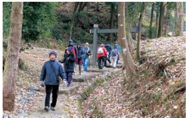
散策を楽しむ参加者

参加者は、名鉄明智駅を出発し、明智城址や花フェスタ記念公園、道の駅「可児ッテ」などを巡る散策を楽しみました。途中、地元有志と市観光協会による豚汁やサヨリめし、ぜんざいの振る舞いもありました。