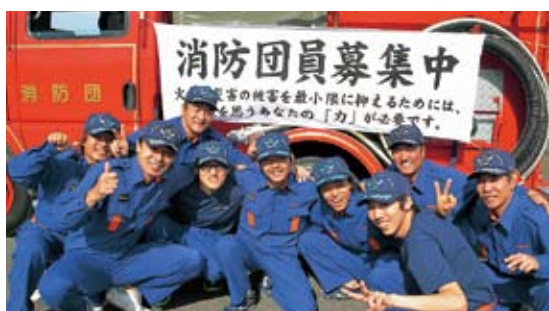
オレンジリボンたすきリレーを走り終えての一こま児童虐待防止のPRにも一役買った