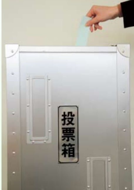
平成21年第45回衆議院議員総選挙の投票結果 ～5歳ごとの投票率～ (※小選挙区の数値)