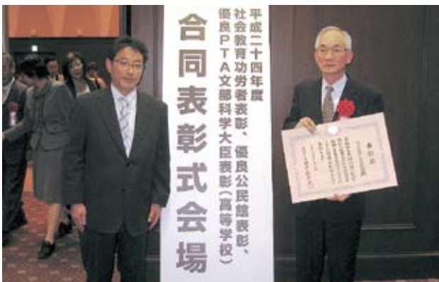
文部科学省で受賞した高相公民館長（右）と安藤公民館主事