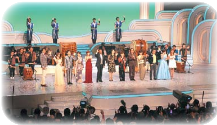
出演者全員によるエンディング

放送は、NHKBSプレミアムで、12月23日（日）午後7時30分から、再放送が29日（土）正午から、25年1月4日（金）午後4時30分から行われます。ぜひ、ご覧ください。