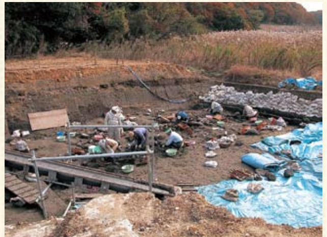
発掘調査当時の写真