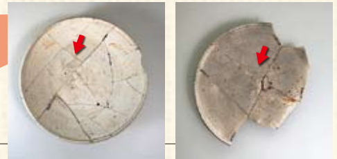
「垣田」と書かれた土器 「石井」と書かれた土器

周辺からは、「垣田」（現在の柿田）、「石井」と書かれた墨書土器が発見され、8世紀ごろ既にこの名称で呼ばれていたことが明らかになりました。そのほかにも弥生時代などの住居の遺構や、同時代の農具などの木製品、鎌倉時代に国家行事に似た儀礼を行っていたことが分かる「仁王会」 にんのうえ の木簡などが発見され、時代ごとの様相が明らかになりました。