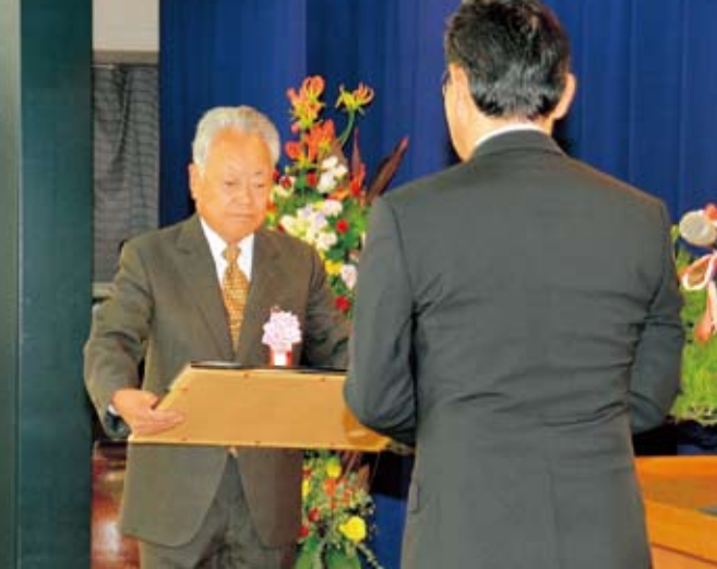
表彰を受ける功労者