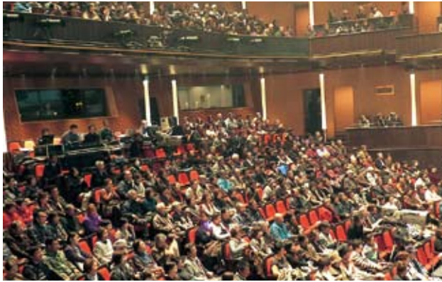
拍手と歓声に包まれた観客席