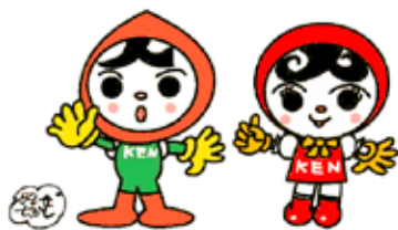
人権イメージキャラクター 人KENまもる君 人KENあゆみちゃん

②「やさしい心」誰も見えてみよう（と思えるように、イラストを中心とした人権パンフレットを発行しています。