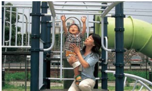
会員同士で子育てを助け合いましょう