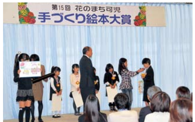
可児っ子賞の受賞者にバラのメダルをかける子ども審査員

今回で最後となる手づくり絵本大賞の入賞者に、会場からは大きな拍手が贈られました。