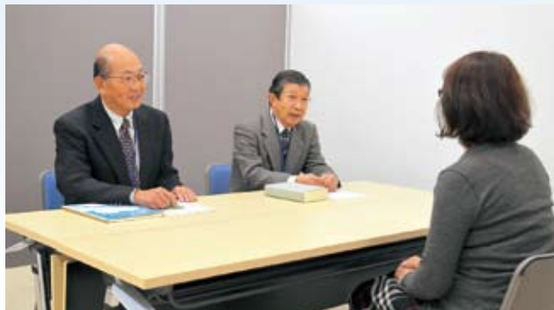
相談時の秘密は固く守られます

○男女共同参画交流サロンと悩み相談（交流サロンと、専任アドバイザーによる悩み相談（予約制）を実施しています。 ○人権困りごと相談（毎月1回、人権相談を開催しています。