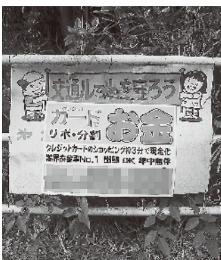
交通安全看板の上に貼られた違法看板