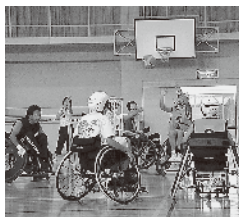
体験する中学生(過去の大会)