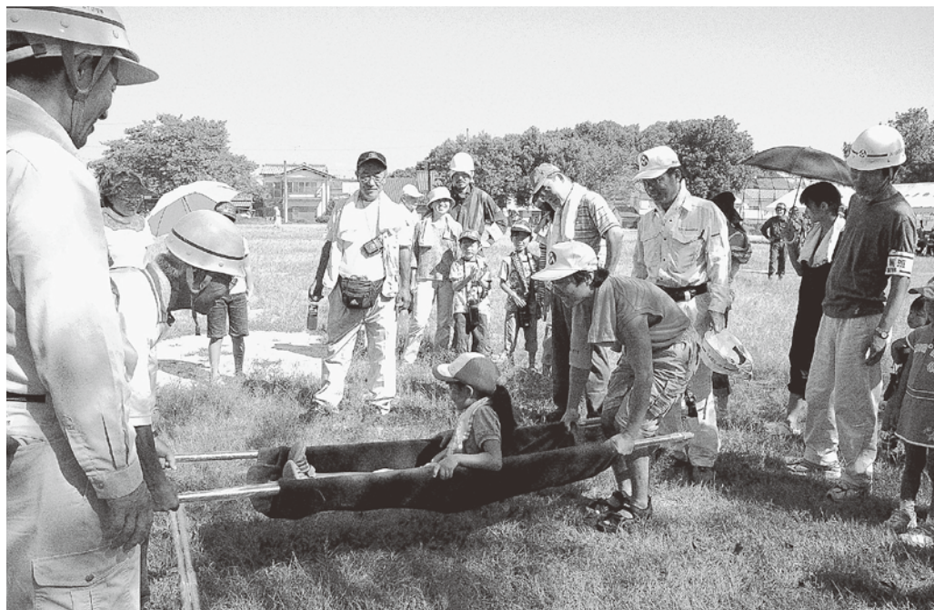
担架で搬送訓練をする様子(一昨年の緑ヶ丘地区) ※昨年の訓練は雨天のため中止でした。