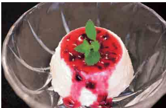
「ひんやりスイーツ」夏のおやつに最適