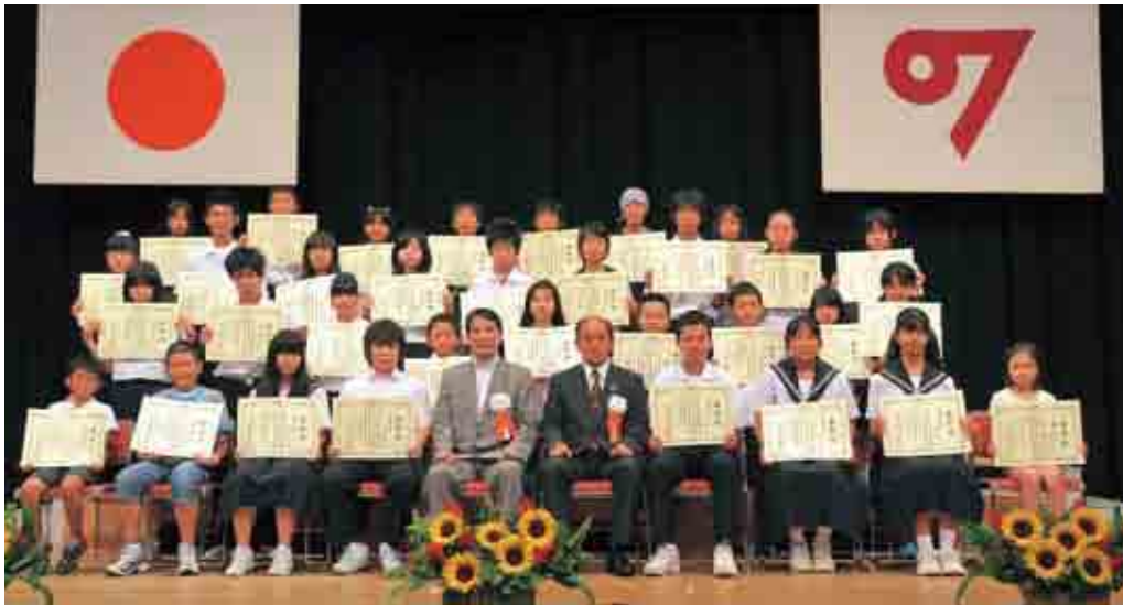
善行少年の表彰を受けた皆さん

少年の主張大会と併せて、人に思いやりを持って接したり、ボランティア活動を行ったりした心の優しい子どもたちをたたえる、善行少年の表彰が行われました。20団体と14人を紹介します。