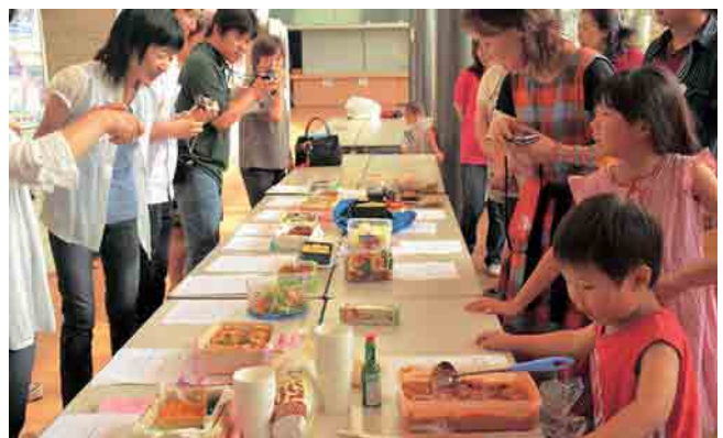
みんなが持ち寄った一品料理を見て、興味津々の参加者

そのほか、子どもが作った一品料理を持ち寄る「見せあっこ」やパネル展示などがあり、参加者は楽しみながら理解を深めました。