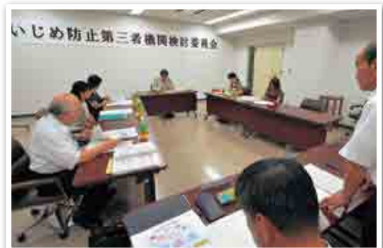
アンケート結果を基に、熱心に討論する委員