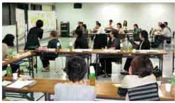
意見を書いた紙を貼り付け、整理する様子

第2回目の協議会では、「若い世代が可児市で暮らしたいと思えるような理想像」をテーマに全体の共通認識を深めました。幼稚園と保育園の2グループでワークショップを行い、両グループで内容を発表しました。