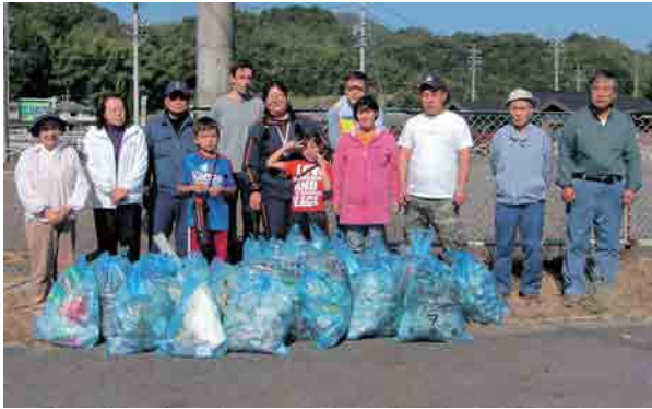
帷子インター付近の清掃で地元の人とコミュニケーションを深めているメンバーたち