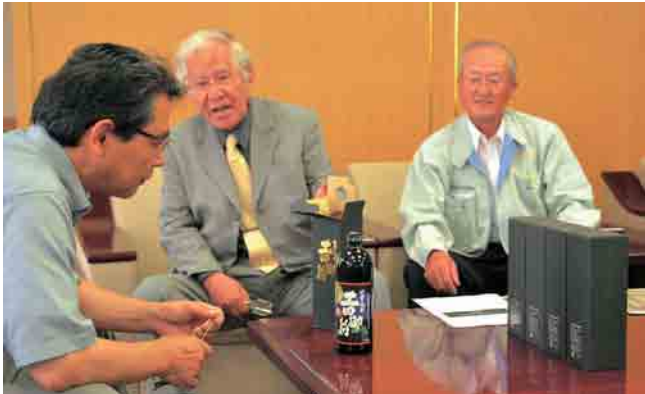
地域経済の活性化のため、活躍しそうな「土田御前」