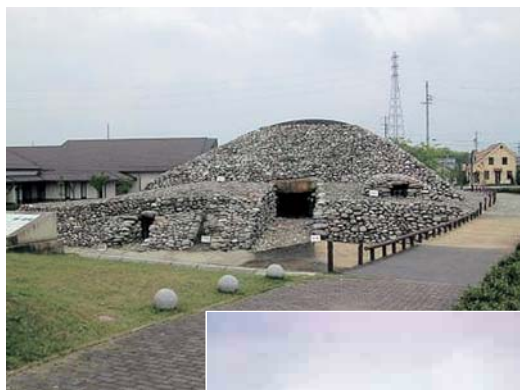
現在の川合次郎兵衛塚1号墳