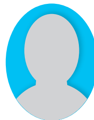
氏名 (敬称略) (地域) 公選・推薦選任の別