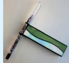
ステンドグラス万華鏡