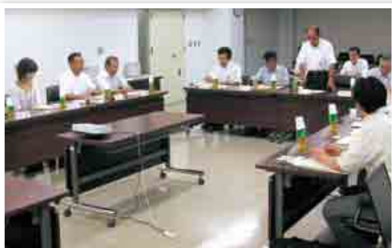
市の教育の現状など説明を聞く委員

市立小・中学校の適正規模および適正配置について検討する委員会です。子どもたちにとって望ましい学校教育環境を整備し、充実した学校教育を実現させるため、学識経験者や市民公募委員など9人で構成しています。