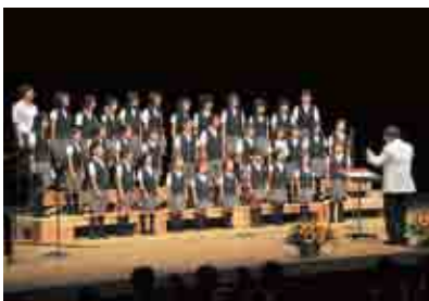
審査の間に行われた「市少年少女合唱団」の合唱