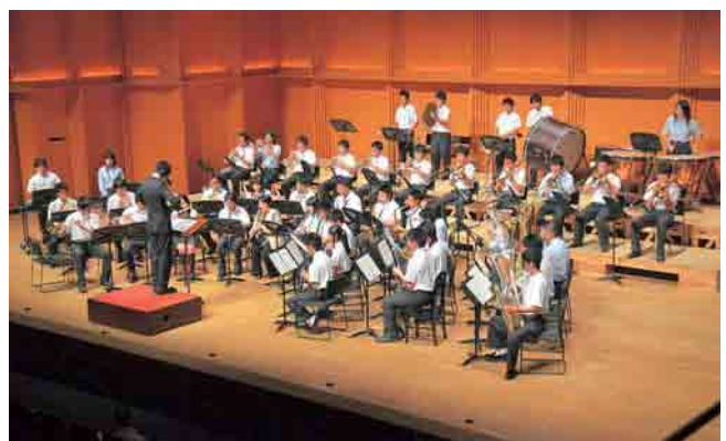
大迫力の演奏をした、東濃高校と可児工業高校の合同バンド