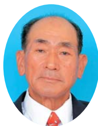
渡邊 院 (西帷子) 公選