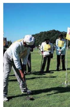
昨年の大会の様子