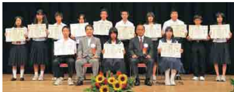
堂々と発表した各中学校の代表者