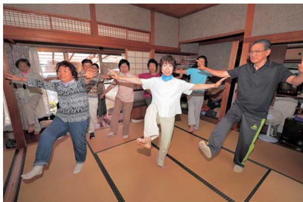
太極拳で汗を流す利用者たち

所在地：今渡 1906-5 開設年月：平成 13年 4月 開所日時：月・金曜日 午後 1時～4時 利用者数：10～15人程度/回 利用料：100円/回