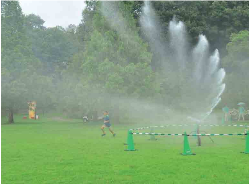
散水用のスプリンクラーを使った花フェスタの人気イベントです。 暑い夏に人も芝も潤い、一石二鳥。