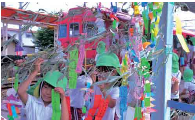
赤い電車を背に、願いを込めて短冊を結び付ける園児たち