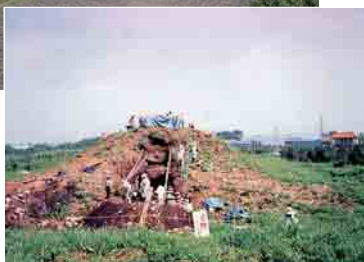
発掘当時の様子（平成3年）