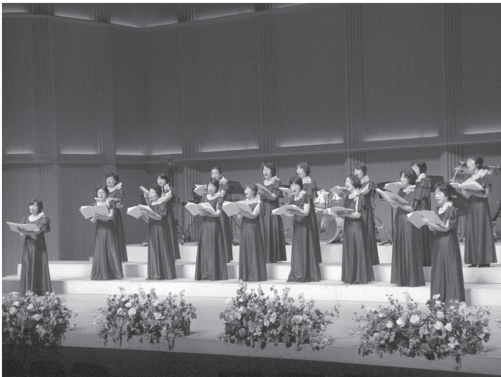
美しいハーモニーを披露する出演団体 (昨年)