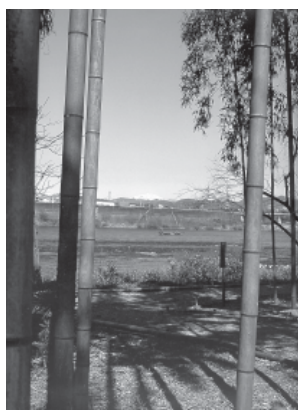
昨年の最優秀作品

作品展示 ○市役所ロビー 10月31日(月)～11月4日(金) ○今渡公民館 11月5日(土)～12日(土) ○土田公民館 11月12日(土)～19日(土)