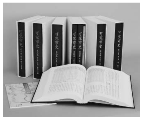
販売中の市史全6巻