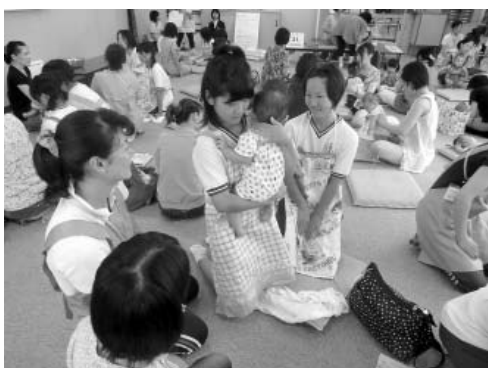
実際に赤ちゃんに触れ合う様子(昨年)