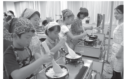
エコクッキングをする様子(昨年)