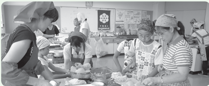
親子で調理をする様子