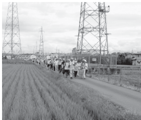
ウォーキングを楽しむ参加者の様子(昨年)