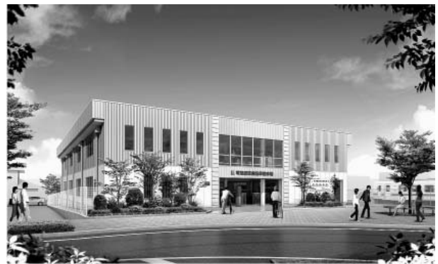
駅東側駐輪場の完成予定図