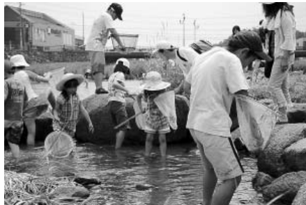
参加した児童たちが水生生物調査をする様子(昨年)