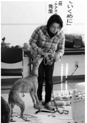
昨年の教室の様子

日時 3月3日(土) 午後1時30分～3時30分 場所 総合会館分室(JR可児駅西) 定員 100人(先着順) 受講料 無料 申込方法 氏名、住所、電話番号を電話、窓口または kankyo@city.kani.lg.jp のいずれかで申し込む 申込締切 2月28日(水)