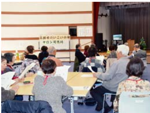
12月18日のサロンではみんなで歌をうたいました

え合い活動助成金制度」の利用団体は、現在27団体になりました。サロン・宅老所は、可児市社会福祉協議会支援団体も合わせると、市内で100カ所ほど運営されています。興味のある方