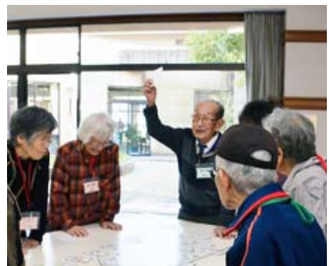
かるたで盛り上がる参加者

は、高齢福祉課や社協に、お問い合わせください。4月から、各地の公民館が地区センターに衣替えします。地区センターが、生涯学習の場という役割に加え、高齢者の皆さんをはじめ、地域の皆さんがもっともっと楽しむ場になってくれることが、その目的の一つです。