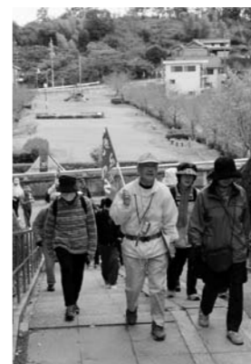
ウォーキングの様子

時間 午前9時30分～正午 期日 1月25日 (木)、2月1日 (木)の全2回 問 介護基礎研修会 高 高齢福祉課 高齢者への接し方や介助の方法など、自宅や地域で介護をする上で必要な介護の基礎知識・技術を学びます。