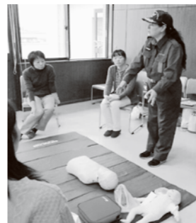
講習の講師を務める女性団員